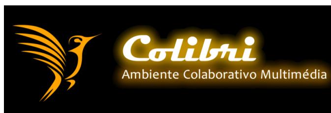
Figura 4: Logotipo do Serviço “COLIBRI – Ambiente Colaborativo Multimédia”

Apesar da sua recente apresentação, o COLIBRI tem gerado muito interesse na comunidade de investigação e ensino nacional devido à sua flexibilidade e facilidade de uso, tendo sido já apontados alguns casos de uso interessantes, os quais podem ser consultados no site do serviço: http://colibri.fccn.pt