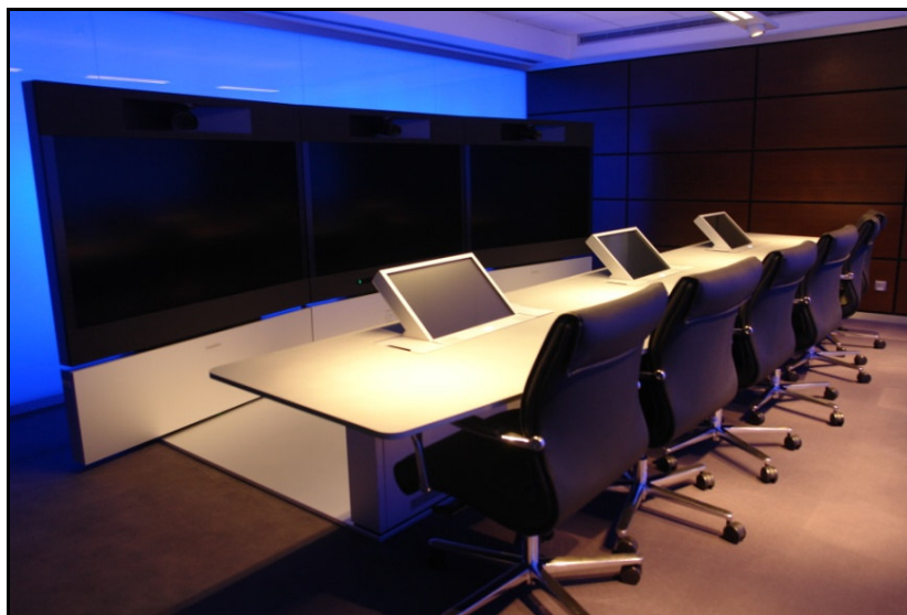
Figura 3: Fotografia da Sala TejoHD

Foi também adquirida e instalada uma nova unidade que permite a multi-conferência entre terminais de videoconferência. Esta nova unidade permite ligações em HD com um conjunto de serviços adicionais ao nível de Layout, acesso e gestão de sessões. Foram criados os serviços de MCU Virtual e IPVCR, os quais, permitem às instituições gerirem recursos de MCU e de gravação H.323 de forma independente e autónoma dos serviços centrais da FCCN.