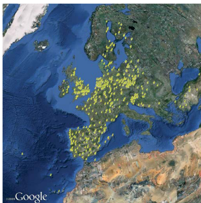
Membros Eduroam - Europa ( http://monitor.eduroam.org/kml/all.kml )